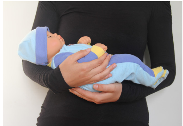
Rechterarm van de baby wordt vastgehouden zodat deze niet kan vallen