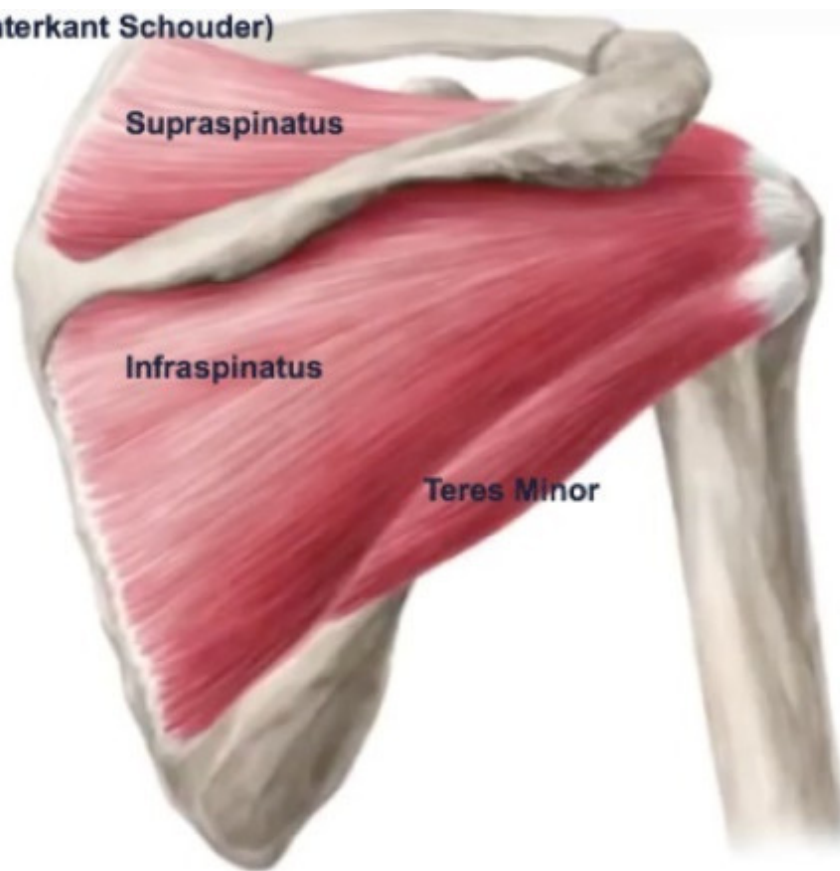
Figuur 2: Rotator Cuff