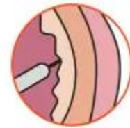
Injectie in de blaaswand