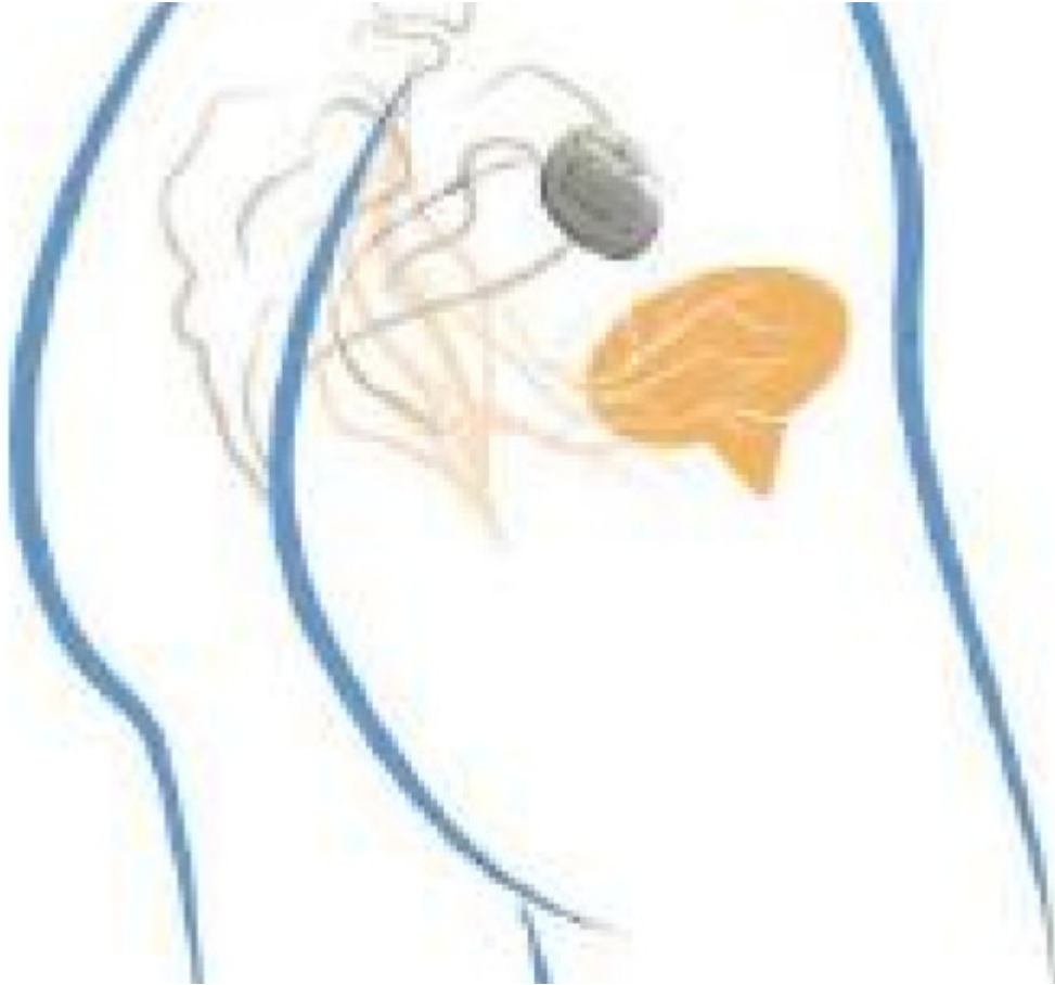
Geïmplanteerde neuromodulator