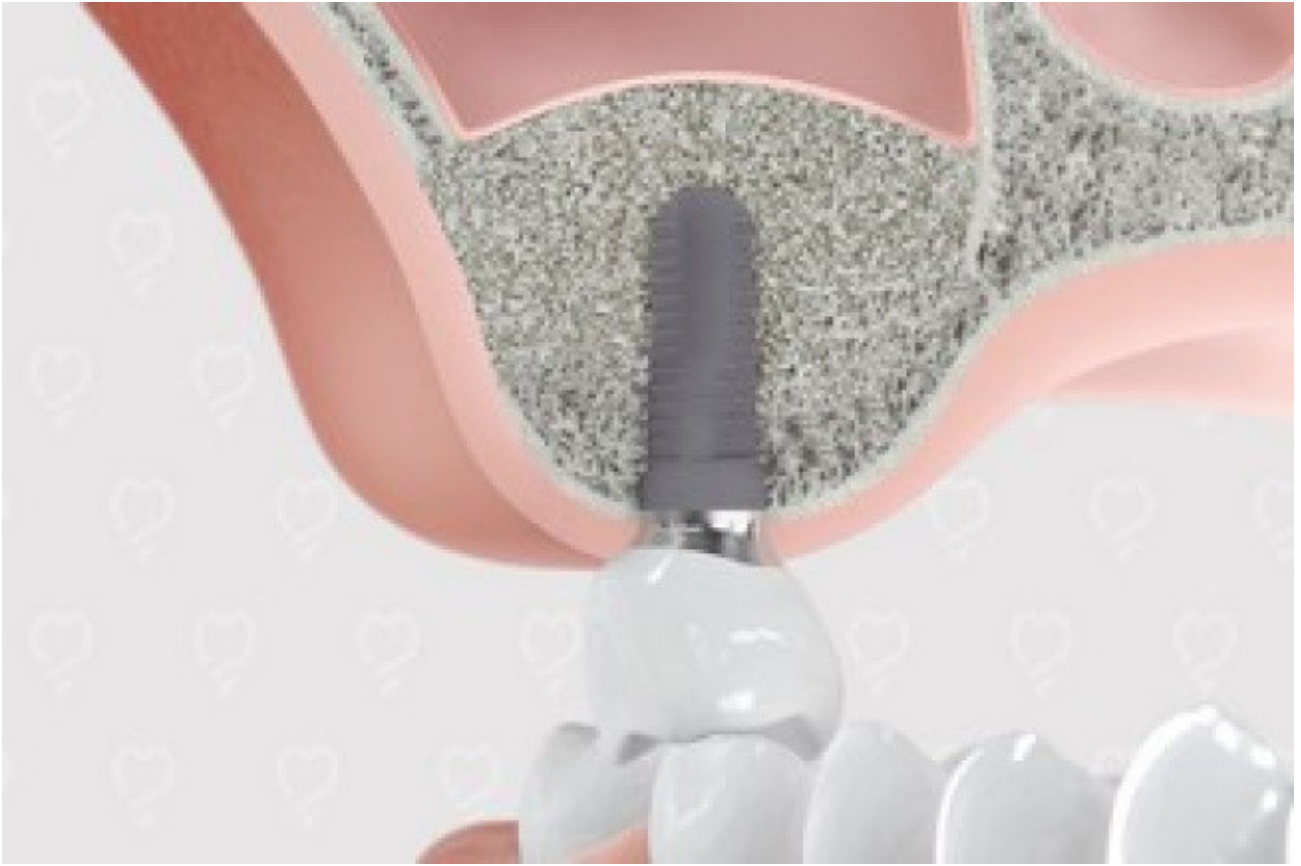
3. Eindresultaat na botopbouw