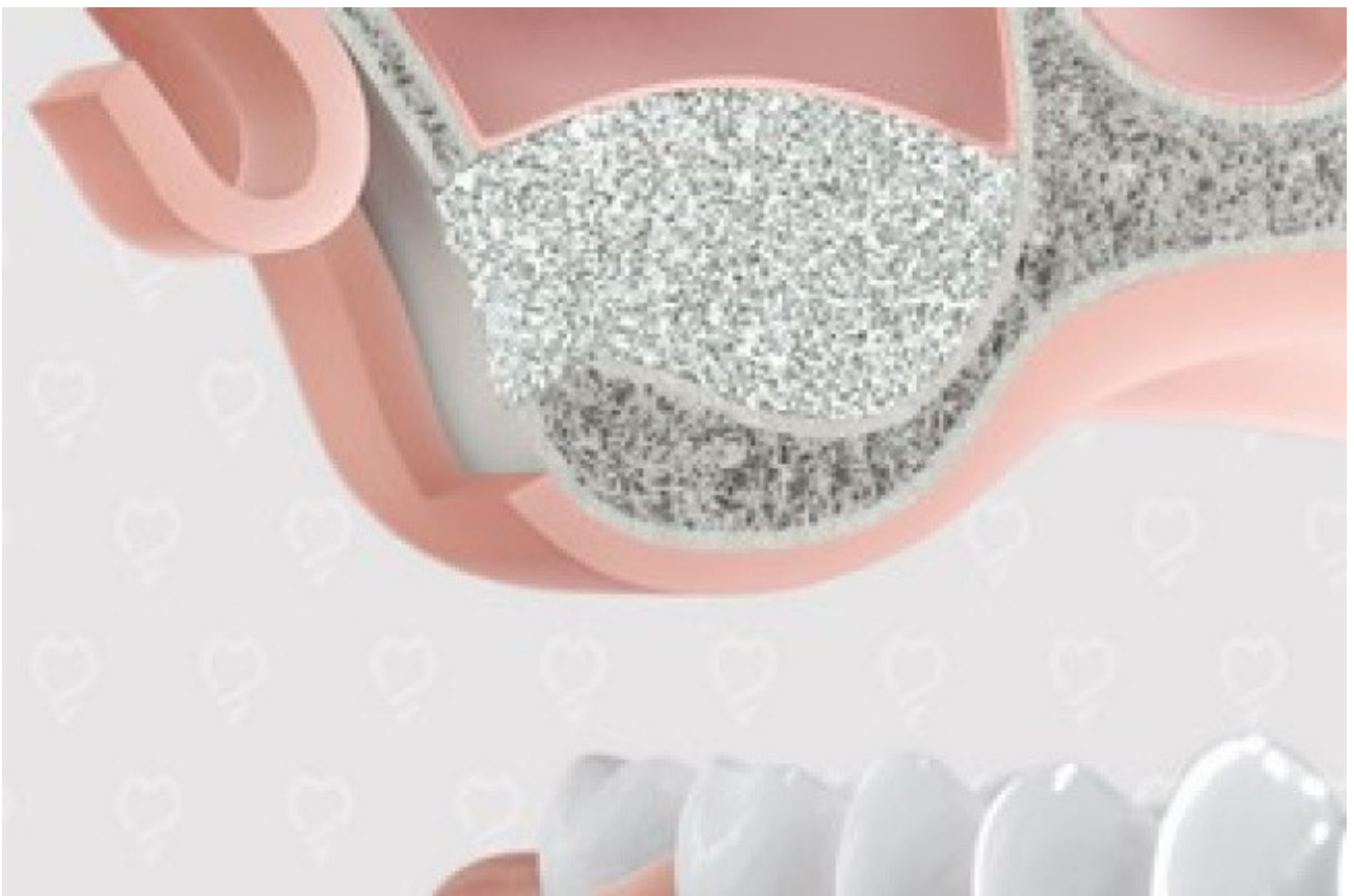
2. Botopbouw in de bovenkaak: sinusbodemplafondverhoging