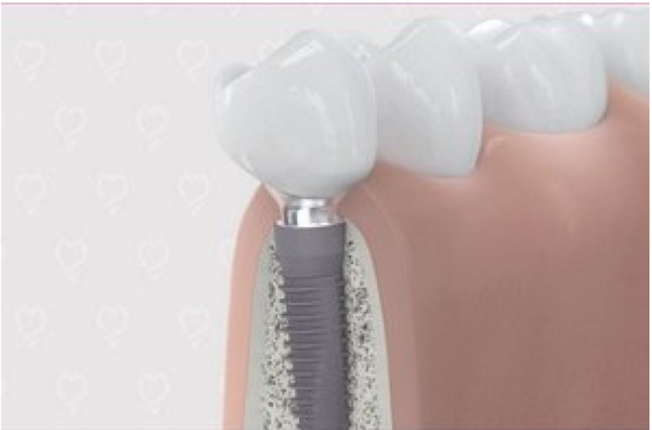
3. Eindresultaat na botopbouw