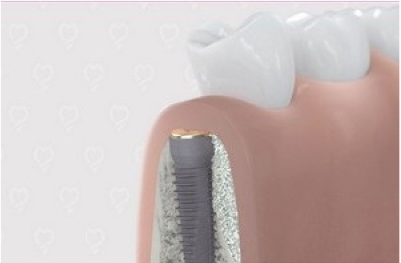
2. Botopbouw in de onderkaak