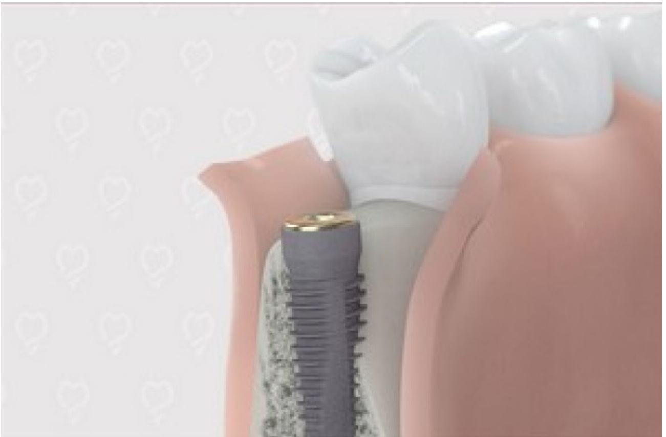
1. Te weinig bot in de onderkaak