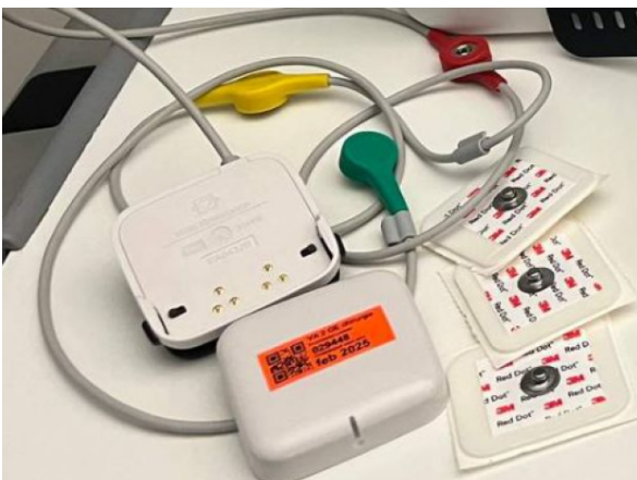
ECG Sensor met plakkers