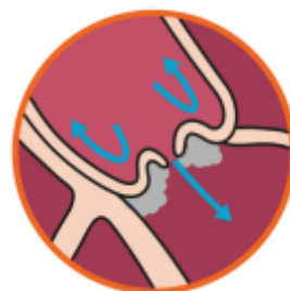
Aortaklep met bacteriële endocarditis