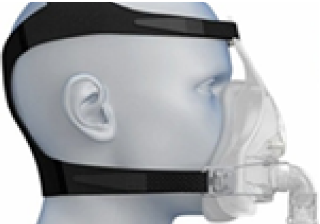
Afbeelding 1: Masker voor non-invasieve beademing