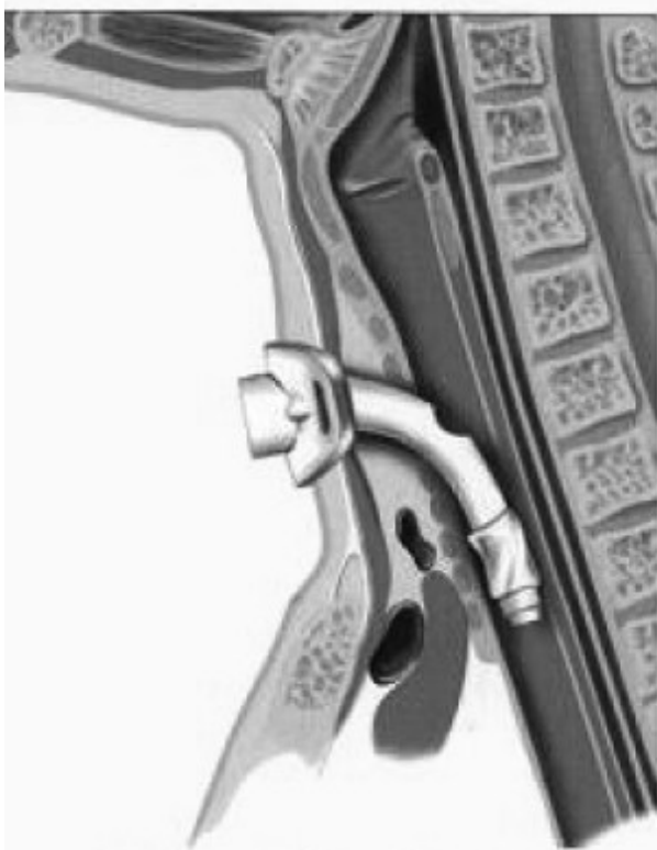
anule in de luchtpijp

De onderstaande tekening geeft de ligging van een tracheacanule weer.