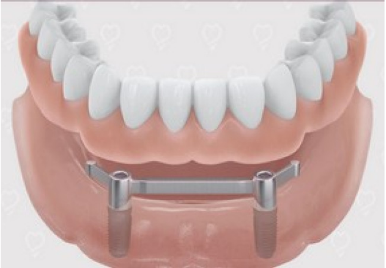
Uitneembare prothese bevestigd met een steg - onderkaak