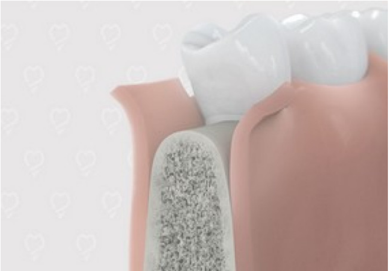
1. Kaakbot wordt blootgelegd