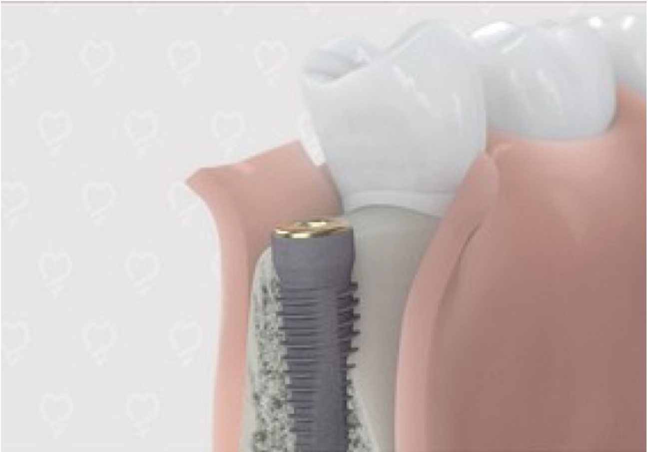
1. Te weinig bot in de onderkaak