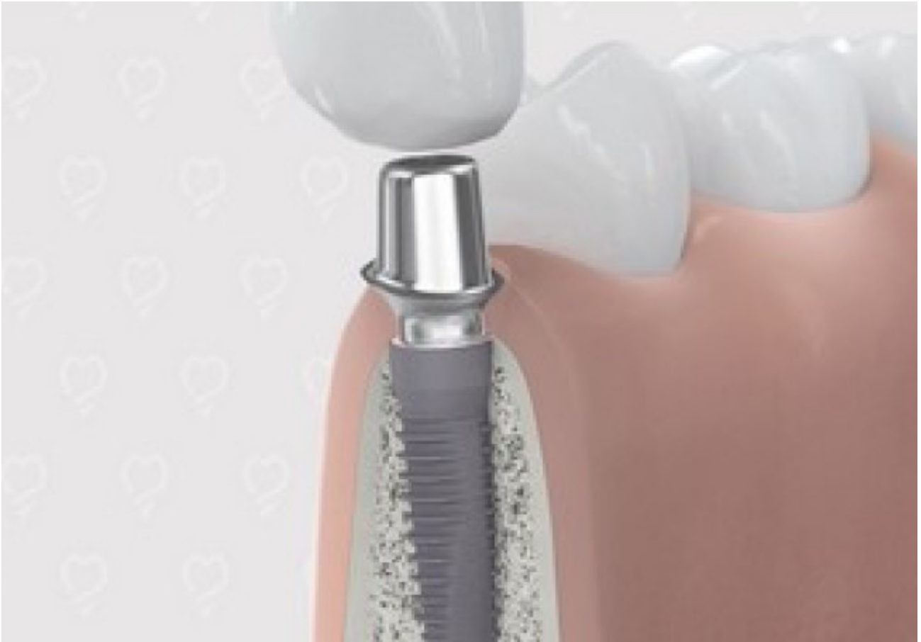
4. Plaatsen van abutment en kroon