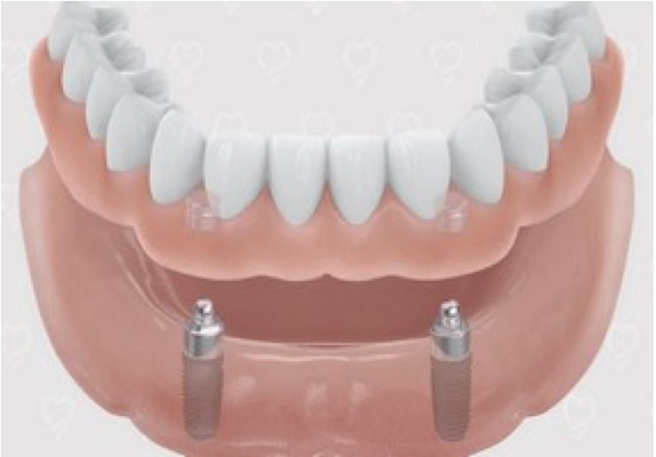
Uitneembare prothese bevestigd op drukknopen