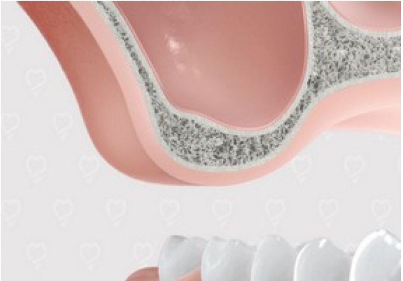
1. Bovenkaak met te weinig bot