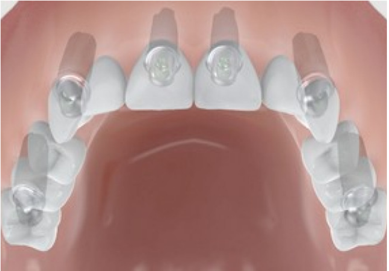
Volledig gebit boven- of onderkaak vervangen - uitneembare prothese