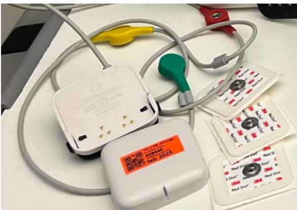
ECG Sensor met plakkers