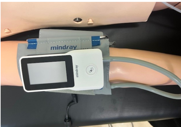
Band met een meetapparaat om uw bloeddruk te meten.