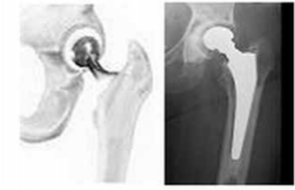
Figuur 1: heupprothese

Bij een totale heupvervanging worden beide gewrichtsuitenden van de heup (de kop en de kom) verwijderd en vervangen door een kunstheup.