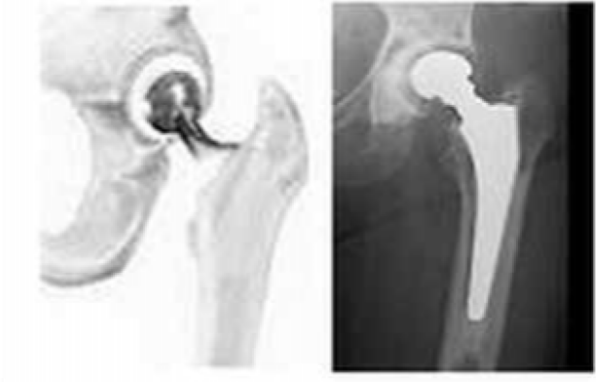
Figuur 1: heupprothese

Bij een totale heupvervanging worden beide gewrichtsuitenden van de heup (de kop en de kom) verwijderd en vervangen door een kunstheup.