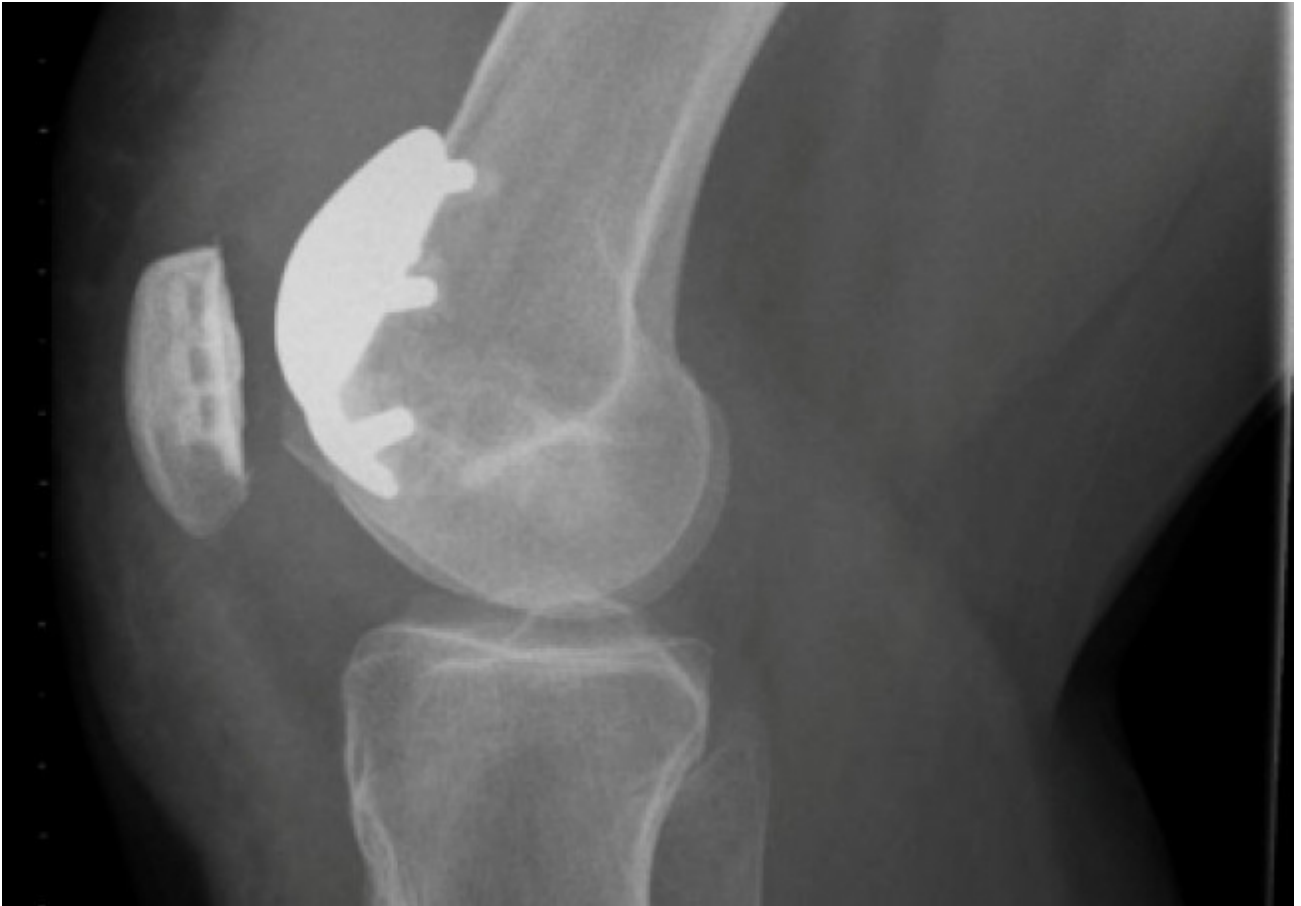
Knieschijfprothese - zijaanzicht