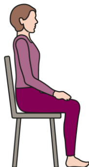
Op de stoel