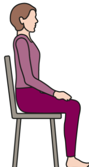
Op de stoel