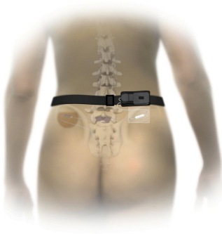
Uitwendige neuromodulator

Het aansluiten en activeren van de neuromodulator gebeurt 's middags op de afdeling of de volgende ochtend op de polikliniek door de arts of physician assistant. Het verlengkabeltje wordt aangesloten op de uitwendige neuromodulator, die u in een gordel onder de kleding draagt. De neuromodulator geeft stroompjes af en stimuleert de zenuw. De afstandsbediening voor de uitwendige neuromodulator werkt draadloos, hiermee kunt u zelf de sterkte van de prikkeling aanpassen. Naast de uitleg krijgt u tevens de nodige informatie en instructies mee.