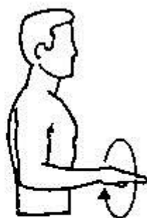
Pronatie handpalm naar onder

Buig naar voren met de romp en draai kleine cirkels met de arm