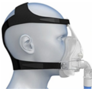
Afbeelding 1: Masker voor non-invasieve beademing