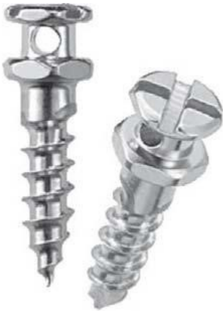
Het orthodontisch minischroefje

Onder plaatselijke verdoving plaatst de kaakchirurg het schroefje met een soort schroevendraaier in het bot. Het kan zijn dat er eerst een klein gaatje geboord moet worden. De schroefjes kunnen maanden tot jaren blijven zitten. Na afronding van de orthodontische behandeling worden ze weer verwijderd.