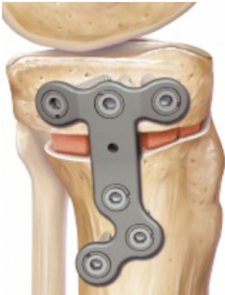
Open wig (vooraanzicht): bot wordt vastgezet met metalen plaat en schroeven.