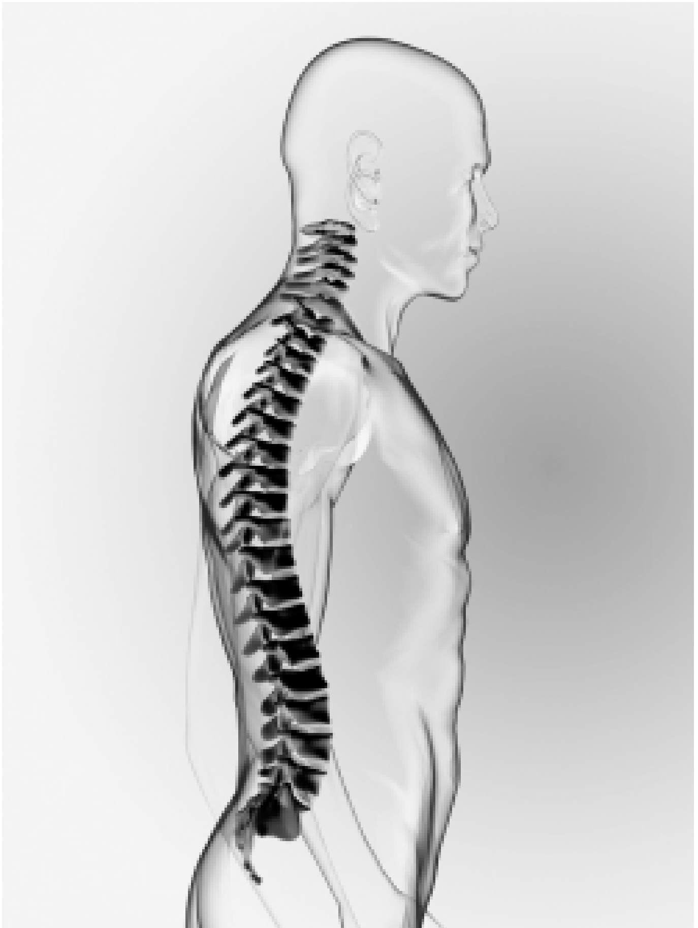
Normale ruggengraat van opzij gezien.