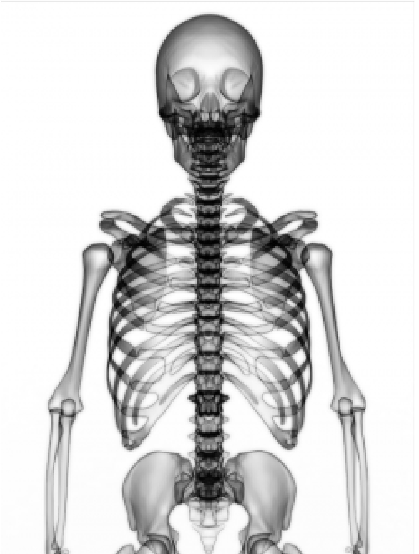
Normale ruggengraat van voren gezien.