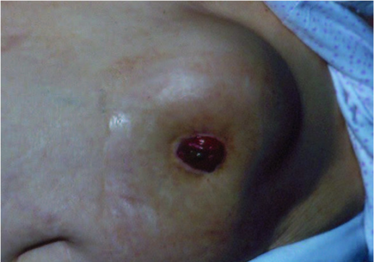
Afbeelding: foto van een stomabreuk