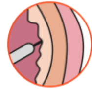
Injectie in de blaaswand